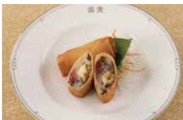
もずくとエビ入りチーズ春巻 Mozuku Seaweed and Shrimp Spring Rolls 2個 ¥800 4個 ¥1,600