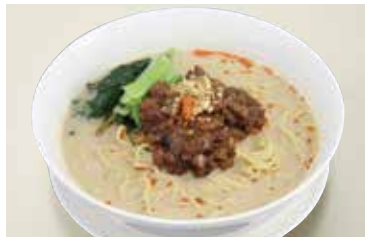
担々麺 Dan Dan Noodles ¥2,000