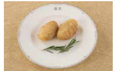
五目包み揚げ Fried Minced Meat Dumplings 2個 ¥700 4個 ¥1,400