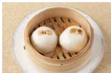
沖縄県産田芋あん饅頭 Steamed Bun Stuffed with Okinawan Taro 2個 ¥700 4個 ¥1,400