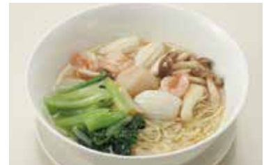
海鮮汁そば Seafood Noodles Soup ¥2,100