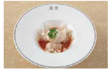
四川風ワンタン Szechuan Style Wonton Dumplings 2個 ¥500 4個 ¥1,000