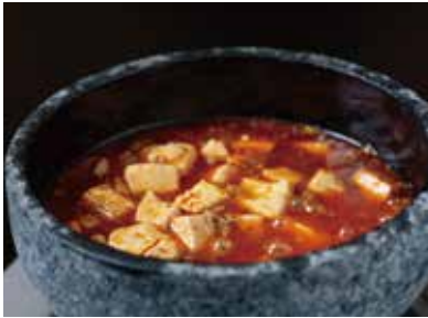
四川風麻婆豆腐 Szechuan Style Braised Tofu with Minced Pork Red Chili Sauce ¥1,500