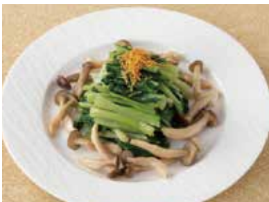
国産葉野菜の炒め物 (粟国塩) Wok-Fried Vegetable of the Day with "Aguni" Okinawan Sea Salt Flavor ¥1,400