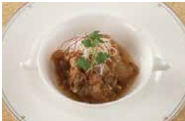
軟骨ソーキの梅肉蒸し Steamed Pork Ribs with Plum Sauce ¥700