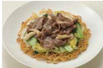
牛肉焼きそば Beef Fried Noodles ¥2,000