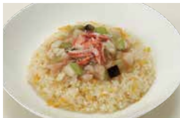
海の幸入り餡かけ炒飯 (スープ付) Fried Rice with Sticky Seafood Sauce and Chef's Daily Soup ¥2,100