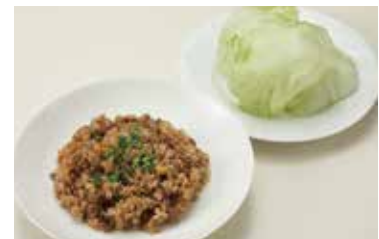
牛肉炒飯レタス包み (スープ付) Beef Fried Rice with Lettuce and Chef's Daily Soup ¥1,800