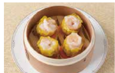
海老焼売 Shaomai Shrimp Dumplings 2個 ¥600 4個 ¥1,200