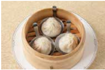
肉汁たっぷり小龍包 Steamed Soup Dumplings 2個 ¥600 4個 ¥1,200