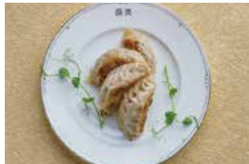
広東風焼き餃子 Fried Dumplings 2個 ¥500 4個 ¥1,000