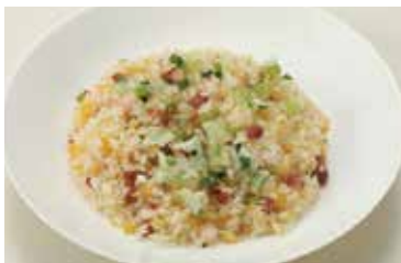
五目炒飯 (スープ付) Mixed Fried Rice and Chef's Daily Soup ¥1,800