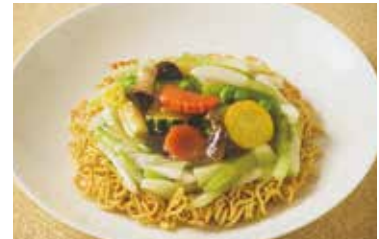
野菜焼きそば Vegetable Fried Noodles ¥2,000