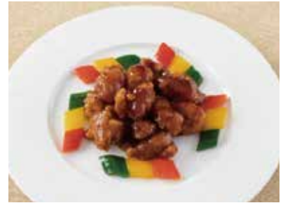
沖縄県産豚肉の甘酢煮 県産シークワサーの薫り Sweet and Sour Pork Flavored Okinawan Citrus ( Using Okinawan Pork ) ¥1,700