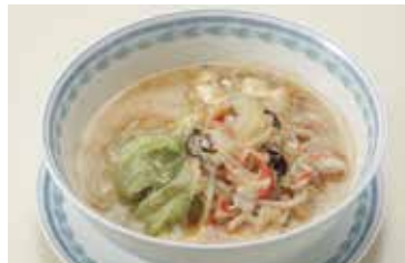
四川風汁そば Szechuan Noodles Soup ¥2,000