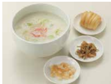
海鮮入りお粥 Cantonese Rice Porridge ¥1,700