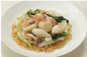
海の幸焼きそば Seafood Fried Noodles ¥2,300