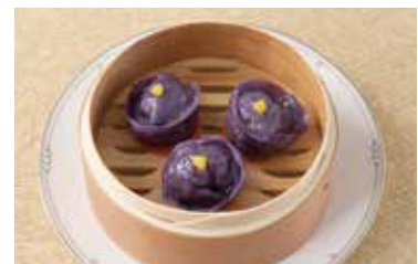
アグー豚肉紅イモ焼売 Shaomai Agu-Pork Dumplings 2個 ¥500 4個 ¥1,000