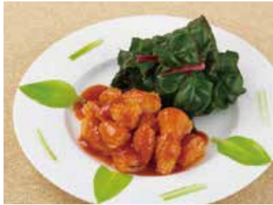
烏賊の紅麴チリソース Wok-Fried Cuttlefish with Red Yeast Chili Sauce ¥1,700