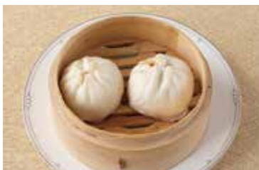
叉焼入りまんじゅう Barbequed Pork in Chinese Bun 2個 ¥800 4個 ¥1,600