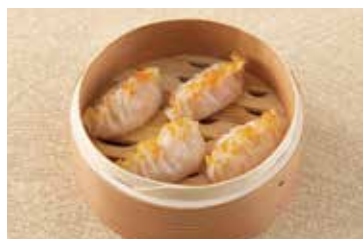
帆立入り蒸し餃子 Steamed Scallop Dumplings 2個 ¥800 4個 ¥1,600