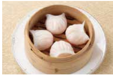
広東風エビ餃子 Steamed Shrimp Dumplings 2個 ¥600 4個 ¥1,200