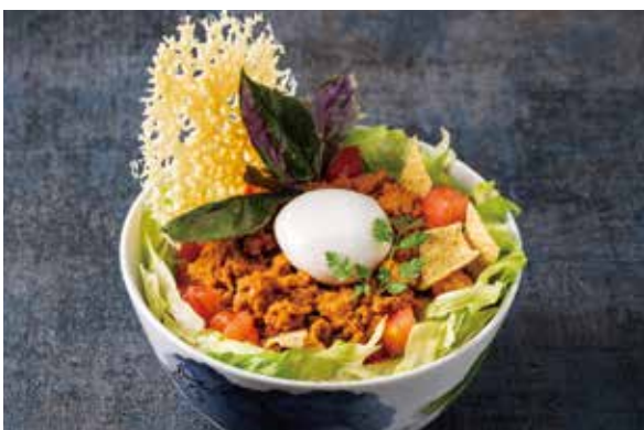
SUI とろーり温玉タコライス Taco Filling and Rice with Soft-boiled Egg

黒豚の骨付きトマホークを氷温熟成し、低温調理でお肉を柔らかく、じっくりと旨味を閉じ込めました。 表面にアンダンスー(油味噌)を塗り炙ることで風味を高め、満足度の高い豪快な丼ぶりに仕上げました。