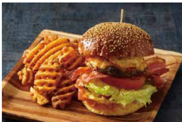
ダブルツリーバーガー DoubleTree Burger