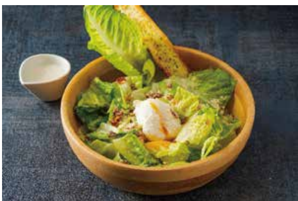
シーザーサラダ Caesar Salad ¥1,700