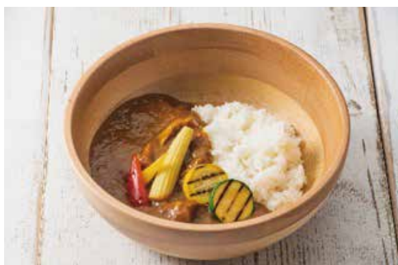
チキンカレー Chicken Curry with Steamed Rice ¥2,300