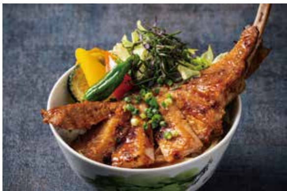
SUI 黒豚トマホーク丼 Kurobuta Pork Steak Bowl Dish

ホテルメイドのバンズにビーフ100%の肉々しいジューシーなお肉とフレッシュな野菜を合わせ、ダイナミックな仕上がりのオリジナルバーガーをぜひお楽しみください。