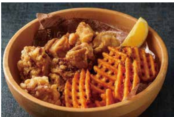
フライドチキン&フライドポテト Fried Chickens and French Fries ¥1,900