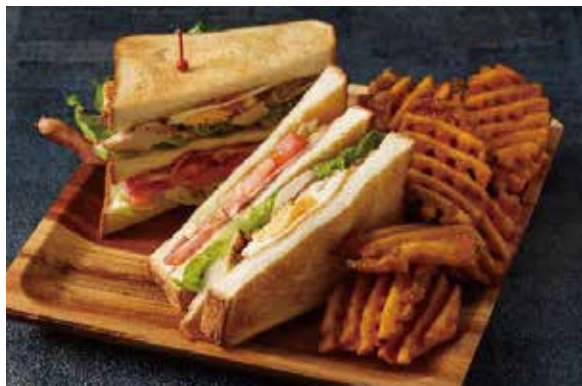
アメリカンクラブハウスサンドウィッチ American Clubhouse Sandwich ¥2,500